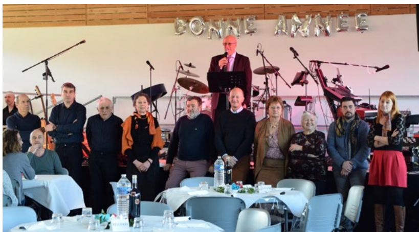
Cérémonie des vœux du 5 janvier 2020, M. le maire et les conseillers municipaux.

En raison du Brexit, les ressortissants britanniques ne peuvent ni voter, ni se présenter aux prochaines élections municipales. C'est une situation injuste, en particulier pour ceux qui participent activement à la vie du village (associations, journées citoyennes...). En tant que propriétaires, ils sont tous concernés par les décisions municipales.