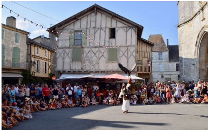
Rapaces lors de la Médiévale du 12 août