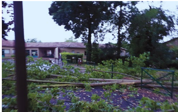
Tempête du 9 août