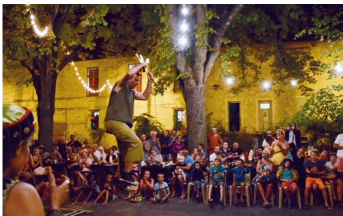
Soirée médiévale du 12 août