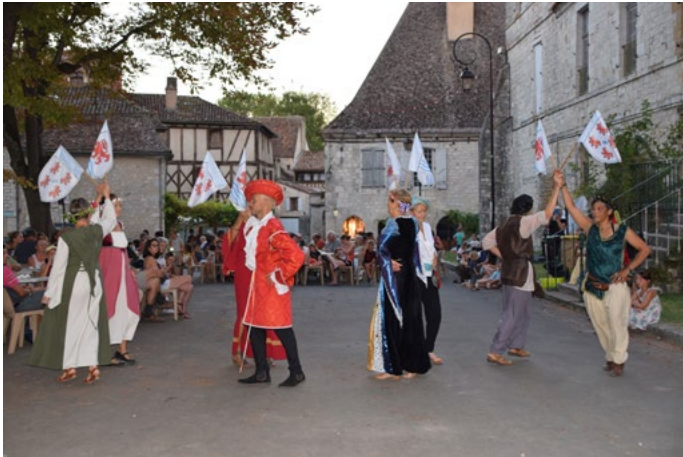
Danses médiévales le 21 août

L'association tient à remercier tous les bénévoles qui se sont impliqués à des degrés divers dans l'organisation des différents événements de l'été.