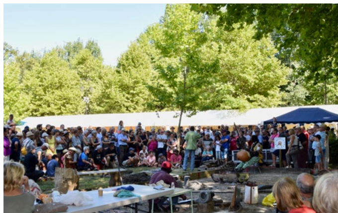
Métallies, le 19 août