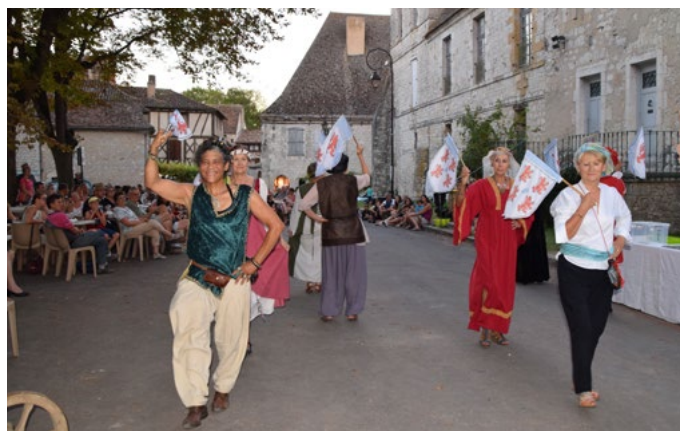
Soirée des Ménestrels, le 21 août