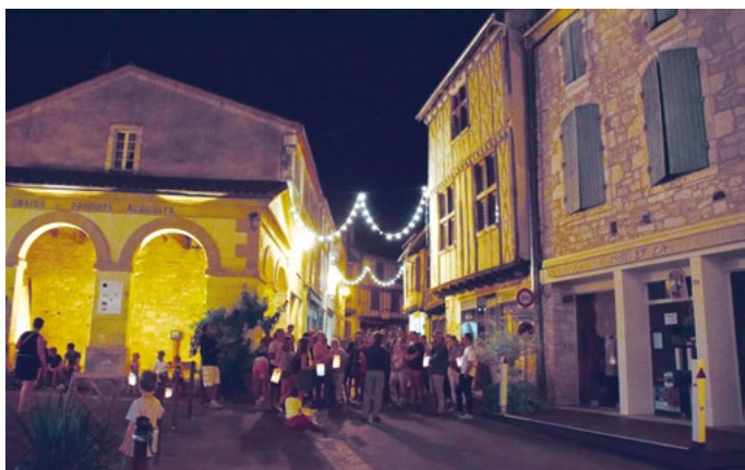
Ballade aux lampions