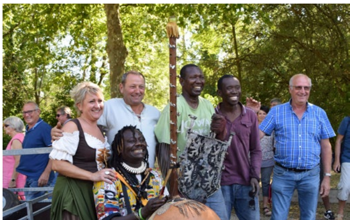
Métallies, le 19 août