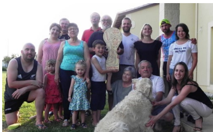
soirée de la finale de la coupe du monde le 15 juillet