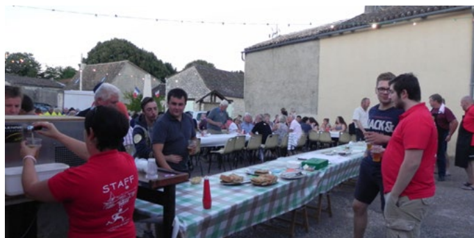
Marché du 17 août

Toute l'équipe du comité vous remercie d'être venu si nombreux lors de nos festivités estivales. Ce fut une réussite grâce à vous, MERCI. Nous vous souhaitons maintenant une bonne rentrée et vous donnons rendez vous en novembre pour le concours de belote.