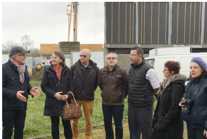
Inauguration du composteur à l'école d'Issigeac

Chacun a apporté sa pierre au projet : les enfants ont trié leurs restes de repas, le personnel de la cantine après y avoir ajouté les préparations de repas et les aliments périmés, a déposé ces biodéchets dans le composteur, la commune d'Issigeac a fourni la matière brune (feuilles et broyat) pour le bon fonctionnement du compostage, notre association a assuré la sensibilisation auprès des élus, du personnel enseignant et des enfants, la formation du personnel de la cantine, le suivi et l'entretien du compostage.