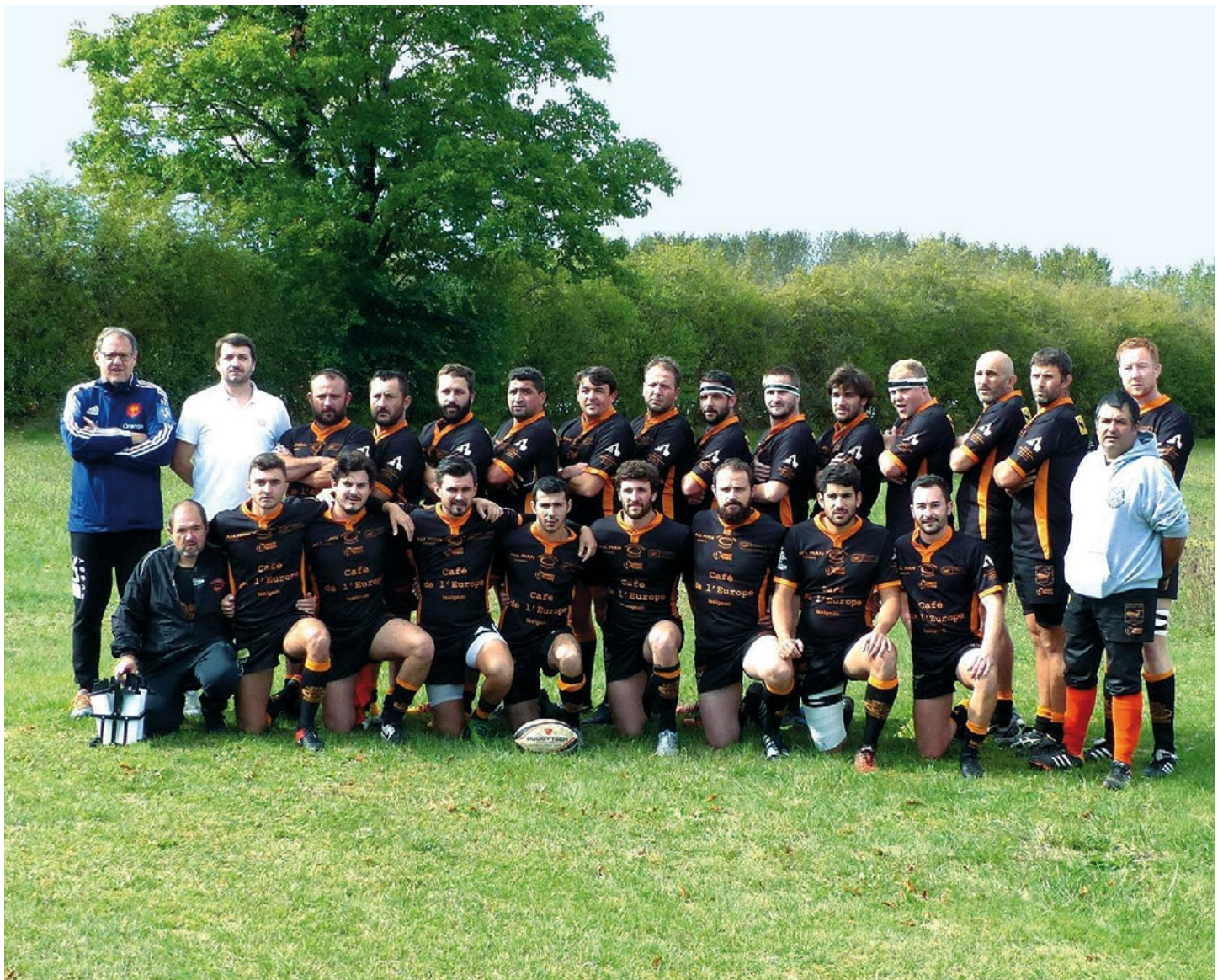
L'équipe de l'UAI qualifiée pour la demi-finale du Périgord Agenais