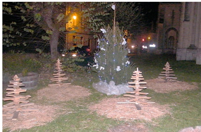
Décoration de la place du village réalisée par les membres du comité des fêtes de Saint-Aubin de Lanquais.