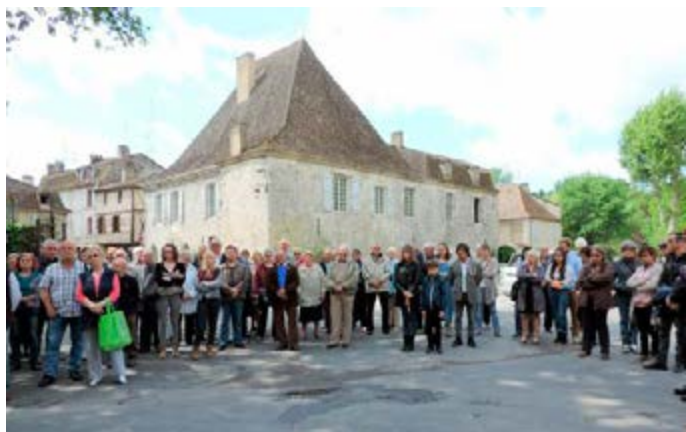
Cérémonie de célébration de l'armistice du 8 mai